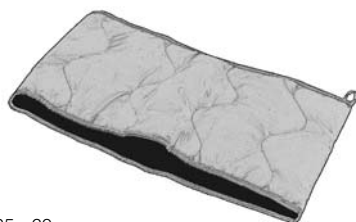
25 x 60 cm