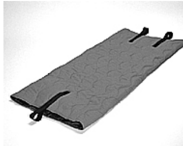
200 x 90 cm